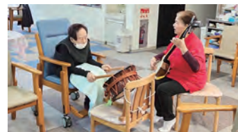
通所介護東市来事業所