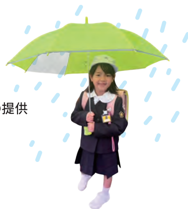
小学校入学お祝いの「傘」