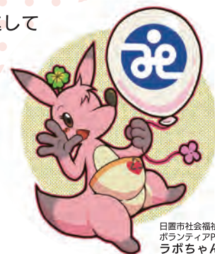
日置市社会福祉協議会 ボランティアPRキャラクター ラボちゃん

今年度も市民の皆様のご支援をいただきながら、さまざまな地域福祉活動を推進してまいりますので、引き続き、ご理解とご協力をお願いいたします。