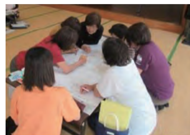
支え合いマップづくり