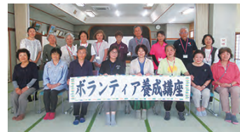
ボランティア養成講座