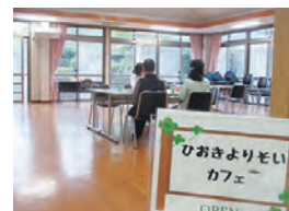
ひおきよりそいカフェ