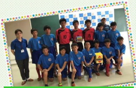
東市来中学校サッカー部 東市来サッカースポーツ少年団

日置市社会福祉協議会では、日本赤十字社鹿児島県支部日置市地区・各分区の事務局を担っており、国内義援金・海外救援金を受付けております。現在、個人や自治会、企業・団体単位等で多数の義援金・救援金が寄せられています。